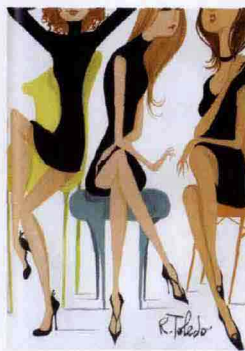
"The little black book of style" Nina Garcia - 144 pagine De Agostini - 19,90 €

lare la vostra identità. La moda passa, lo stile resta, era solita affermare Coco Chanel. E Nina Garcia riprende in pieno questa idea, per presentarvi la sua personalissima opinione. Non un libro di rigide regole, ma il racconto di una vita scandita da originalità e fascino, glamour e buon gusto. Ricordi personali, ritratti di star e icone dello stile, interviste a stilisti e grandi nomi della moda... Accompanate da originalissimi disegni realizzati da Ruben Toledo, le parole di Nina Garcia vi avvolgeranno leggere. Raffinate come un pizzo, eleganti come seta.