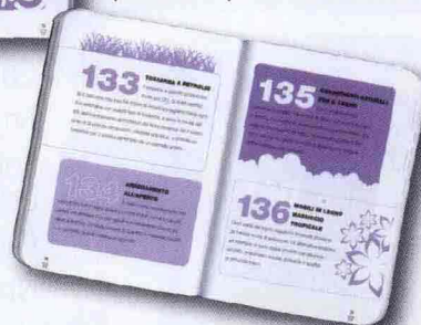
"Il Piccolo Libro Verde dello Shopping", 250 consigli risparmiarsi per voi e per l'ambiente" Diane Millis - 128 pagine Morellini Editore - 11,90 €

mostra come ridurre l'emissione di gas nocivi che causano l'effetto serra, l'inquinamento e i rifiuti grazie ad acquisti intelligenti. Questo libro, in oltre, aiuterà il lettore a riconoscere i prodotti che usano risorse sostenibili e che impiegano processi di produzione 'verdi'.