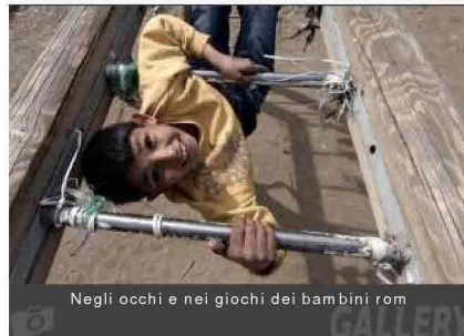
Negli occhi e nei giochi dei bambini rom