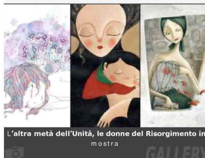
L'altra metà dell'Unità, le donne del Risorgimento in mostra