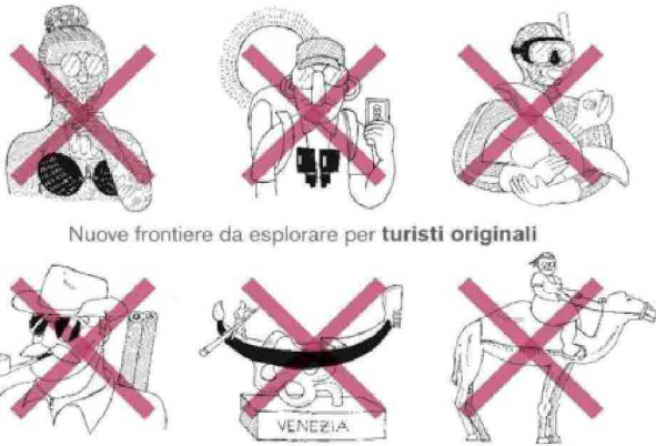
Nuovi Turismi, particolare della copertina