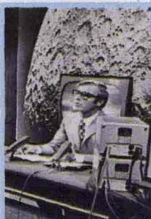
La telecronaca di Tito Stagno