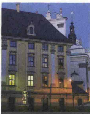
La chiesa e il collegio dei gesuiti, primo nucleo dell'Università di Breslavia

Con la crescente domanda turistica si è moltiplicata anche l'offerta di alberghi a ogni livello, dagli ostelli ai raffinati boutique hotel, passando per i moderni complessi ricettivi capaci di ospitare i grandi gruppi dei viaggi organizzati, che in pochi anni ha colmato la carenza di strutture che avevano caratterizzato la città nei decenni del socialismo. La sistemazione più romantica, è senza dubbio il Dwor Polski 11 hotel all'interno di un palazzo del XVI secolo dove la leggenda vuole che il re Sigismondo III Vasa e la futura moglie Anna di Asburgo avessero i loro incontri segreti. A due passi dalla piazza del mercato, le sue stanze sono arredate in un elegante stile classico (ul. Kielbasnica 2 - Tel. 0048 0 713 723 415 - dworpolski.wroclaw.pl ). Il Patio 12 invece, è una delle migliori strutture ricettive di Breslavia, situato com'è dietro la chiesa di Santa Elisabetta e a due minuti dalla piazza del mercato. I bagni sono quasi lussuosi e gli arredi comodi e sontuosi (ul. Kielbasnica 24-25 - Tel. 0048 0 713 750 400 - hotel-patio.pl ). L' Art Hotel 13 ha il suo punto di forza nella raffinatezza e nell'eleganza, discreta e informale, di un arredamento in stile classico contaminato da opere d'arte contemporanea e qualche tocco di postmoderno. I maggiori luoghi di interesse turistico sono tutti a portata