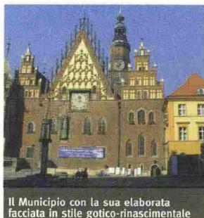
Il Municipio con la sua elaborata facciata in stile gotico-rinascimentale

L'edificio storico per antonomasia è il Municipio con i suoi frontoni e frontoncini, bovine, pinnacoli, torri e torrette e un ricco apparato decorativo che ne fanno un capolavoro di architettura gotico-rinascimentale, edificato tra il 1290 e il 1504 e ritoccato all'inizio del XVII secolo (Ratusz - Rynek, 1 - Tel. 0048 0 713 471 693).