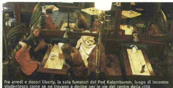
Fra arredi e decori liberty, la sala fumatori del Pod Kalamburem, luogo di incontro studentesco come se ne trovano a decine per le vie del centro della città

La città è un prezioso scrigno ricco di storia e monumenti, che vanno dall'antico municipio alla piazza del mercato, a Ostrow Tumski, l'isola della cattedrale. Il tutto disseminato da decine di gnomi di bronzo che sono l'attrazione più simpatica di questa località. Ma Breslavia non è solamente cultura. Ci si può dedicare allo shopping oppure partecipare all'intensa vita notturna del centro storico.