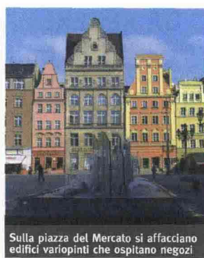
Sulla piazza del Mercato si affacciano edifici variopinti che ospitano negozi

Breslavia Low Cost di Roberto M. Polce (Morellini Editore - pagg. 142 - €11,90), è un ottimo strumento per orientarsi in questa città. Morte a Breslavia , invece, opera del 1999 di Marek Krajewski, pubblicata in Italia da Einaudi nel 2007, è il primo di una serie di romanzi gialli che vi mostrerà la città da un altro punto di vista. Tutte le fotografie in questa miniguide © Roberto M. Polce/ www.viedellest.eu .