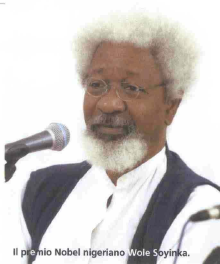
Il premio Nobel nigeriano Wole Soyinka.

Ma è stato edito, allo stesso tempo, un altro suo libro in italiano: una riflessione del 1999, epoca in cui ferveva il dibattito sul diritto al risarcimento dei discendenti degli schiavi africani. Eravamo alla vigilia del terzo millennio, ma a Soyinka stava a cuore, più che il passato remoto, quello prossimo, ancora fumante. La Commissione verità e riconciliazione aveva appena concluso i suoi lavori, e Il peso