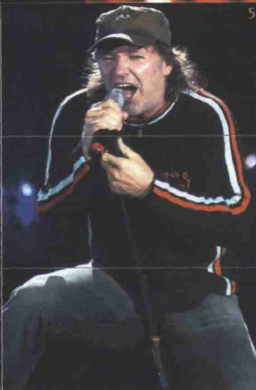
1. George Michael, il 17 luglio a Padova, poi a Lucca e a Roma. 2. Marco Paolini, a Poggibonsi (Siena). 3. La Settimana musicale senese, dal 7 al 14 luglio. 4. I Genesis, a Roma il 14 luglio. 5. Vasco Rossi: il suo tour inizia a Torino il 3 luglio. 6. Gene Gnocchi, al Libra festival, vicino Biella