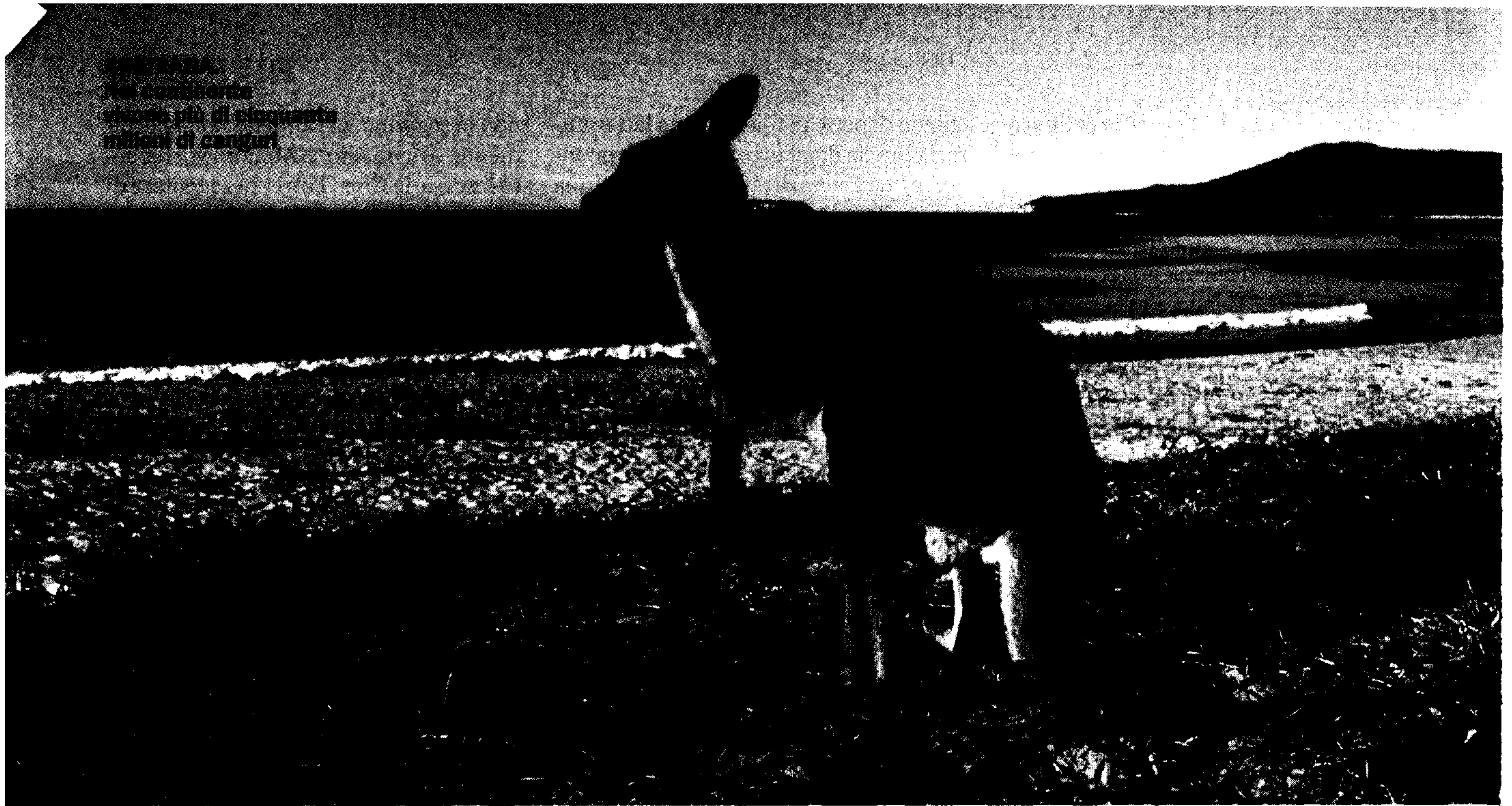
IN AUSTRALIA, il continente più di cinquanta milioni di canguri