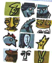
FOIRE DE SAINT-OURS AOSTE 30-31 JANVIER 2011

24 BIMBI OVERSIZE Tuo figlio mangia troppo e sei preoccupata? Un nuovo programma tv insegna a evitare l'obesità. Per partecipare chiama lo 02-36564957 o scrivi a candidature@magnolatv.it